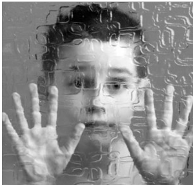
Illustration de la couverture du livre de Raffaele Simone, Presi nella rete. La mente ai tempi del web, Milano, Garzanti, 2012

Dans Pris dans la toile. L'esprit au temps du Web (traduit de l'italien par Gérald Larché, Gallimard, 2012), Raffaele Simone démontre qu'avec Internet et les médias numériques, une troisième révolution s'opère. Cette mutation anthropologique sans précédent, dont les effets sont observables au niveau de la relation au savoir et des rapports sociaux, se caractérise par l'émergence de la médiasphère , culture numérique omniprésente. On assiste à une révolution digitale irréversible des modalités de l'expérience humaine.